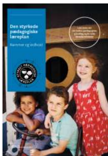
Den styrkede pædagogiske læreplan, Rammer og indhold

Denne skabelon indeholder alle de lovmæssige krav til evalueringen. Lovkravene finder I i de to midterste afsnit "Evaluering og dokumentation" og "Inddragelse af forældrebestyrelsen". Skabelonen indeholder desuden spørgsmål, som kan støtte jeres evalueringsproces samt jeres fremadrettede arbejde med løbende at revidere den skriftlige læreplan.